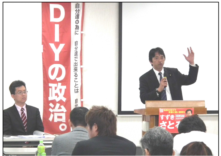
榛葉賀津也・参議院議員が今夏の参院選の意義について熱弁（平成25年5月11日すずきさとる県政報告会）

第九十九条 天皇又は摂政及び国務大臣、国会議員、裁判官その他の公務員は、この憲法を尊重し擁護する義務を負ふ。